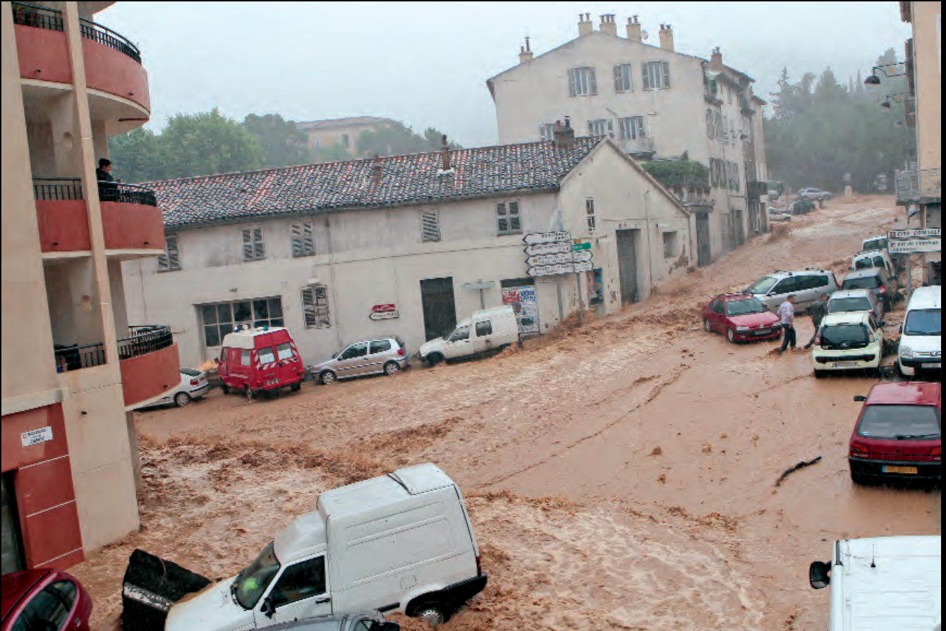
Peu après 17 h, un torrent de boue déferle sur le Boulevard de la Liberté, arrivant tout droit du Malmont et emportant sur son passage véhicules et personnes.