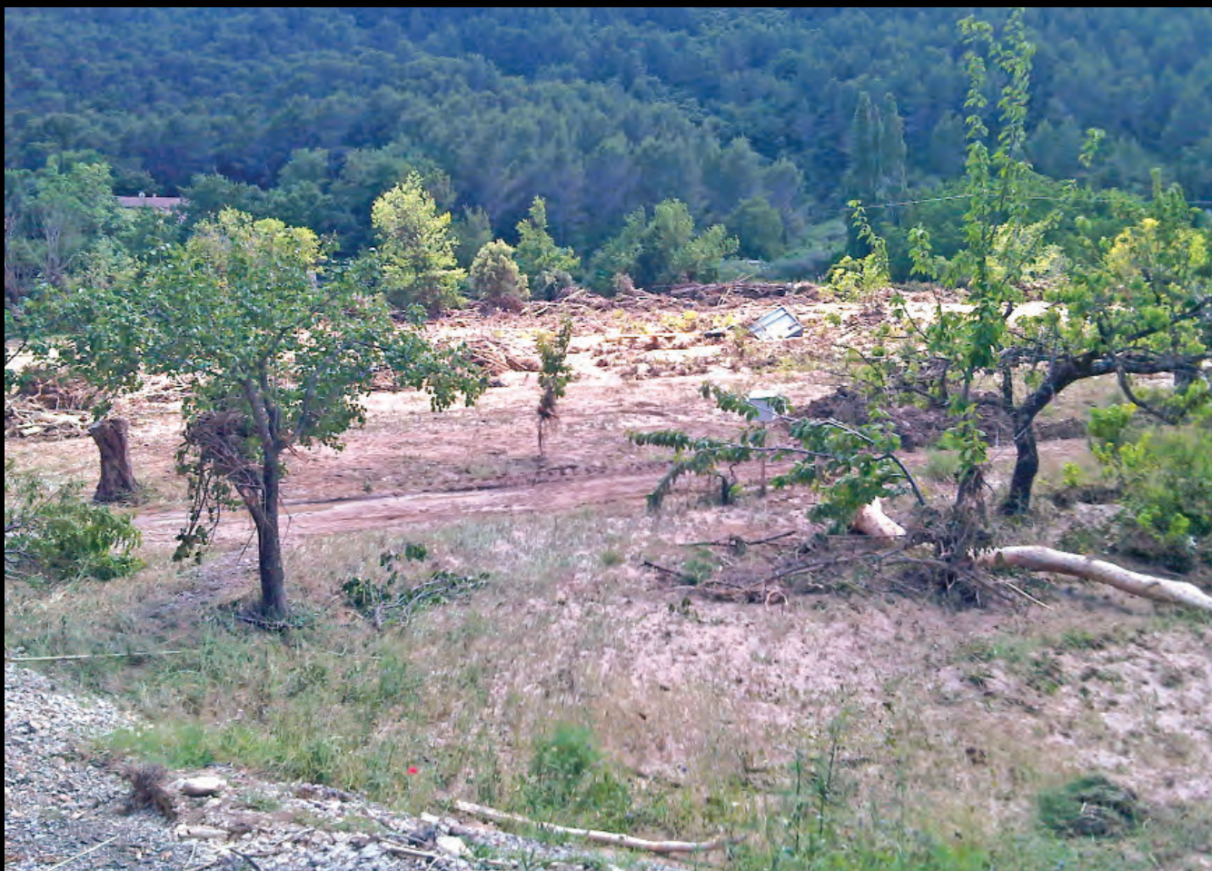
Au quartier de La Clape, la Nartuby a rendu méconnaissable le paysage. L'accès aux habitations sera rendu impossible pendant de trop nombreuses heures.