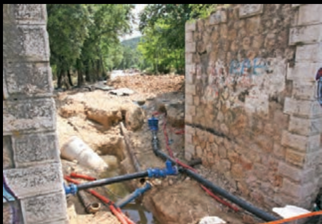
Des ponts détruits et le quartier des Selves transformé en véritable lac...