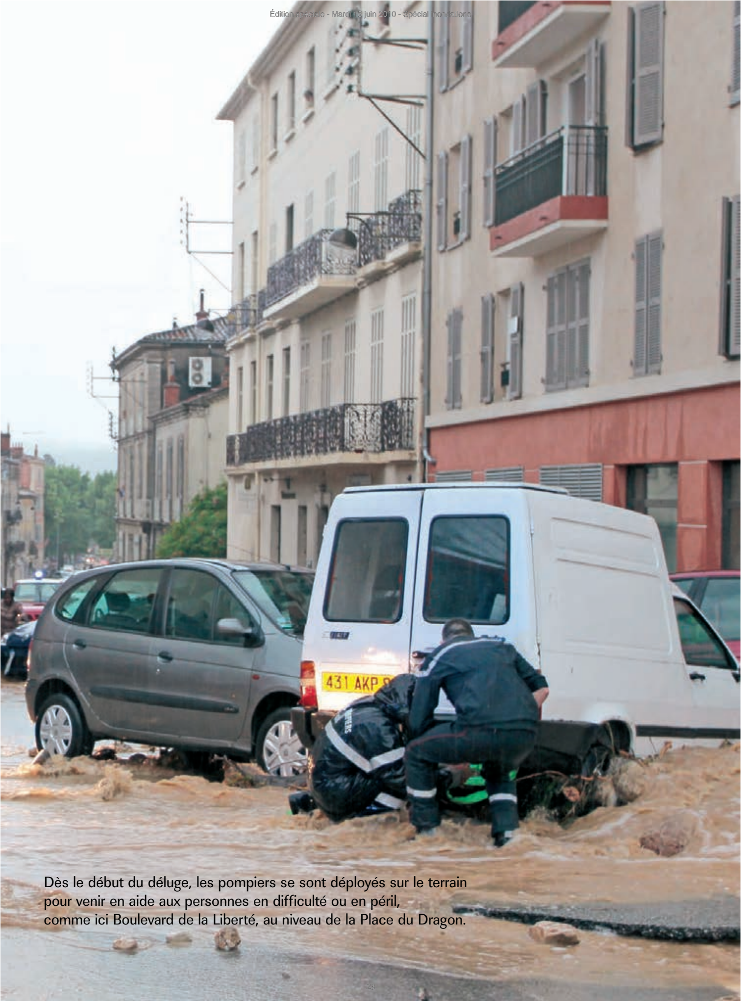
Dès le début du déluge, les pompiers se sont déployés sur le terrain pour venir en aide aux personnes en difficulté ou en péril, comme ici Boulevard de la Liberté, au niveau de la Place du Dragon.