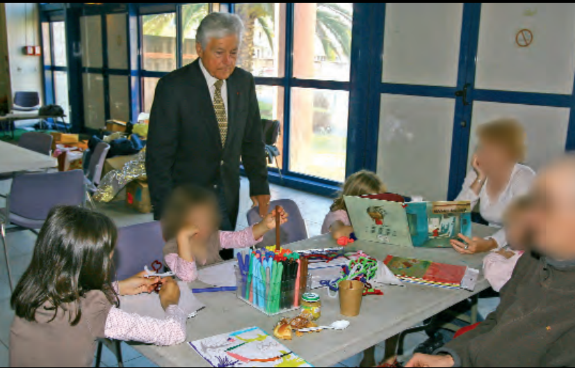
Auprès d'une famille dracénoise sinistrée et recueillie au Complexe Saint-Exupéry

liers... autant des nôtres tout simplement, qui ont trouvé une mort violente, une mort injuste. Que leurs familles soient assurées du fraternel soutien de la communauté dracénoise.