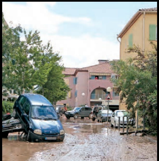
Une catastrophe naturelle qui a jeté à la rue des centaines de familles dracénoises.