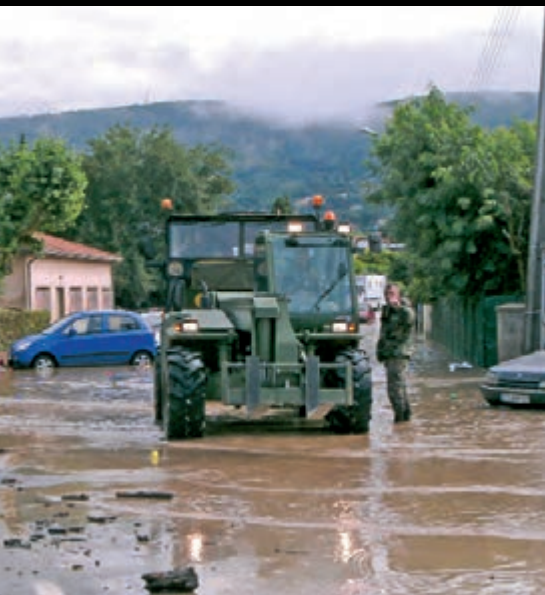
La chaîne de solidarité des hommes en pleine action : pompiers, plongeurs, militaires et bénévoles au chevet des victimes pour nettoyer et sauver ce qui peut l'être.