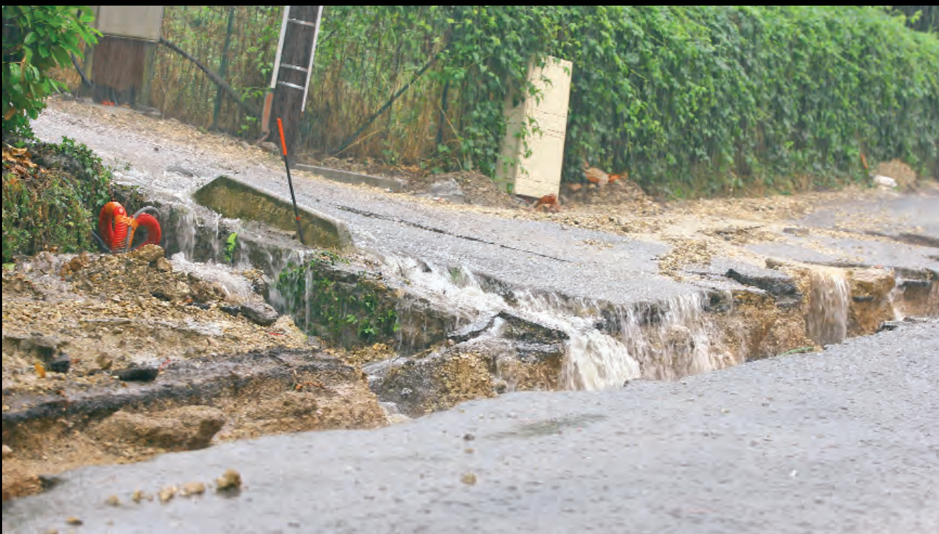
Les voiries et les chaussées brisées par la violence des flots.

Rue des Endronnes, devant l'Hôtel Communautaire, la montée des eaux inondera bientôt sols et sous-sols des bâtiments.