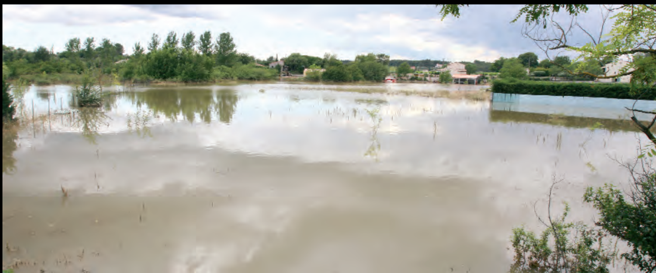
... de même que le stade Gilly