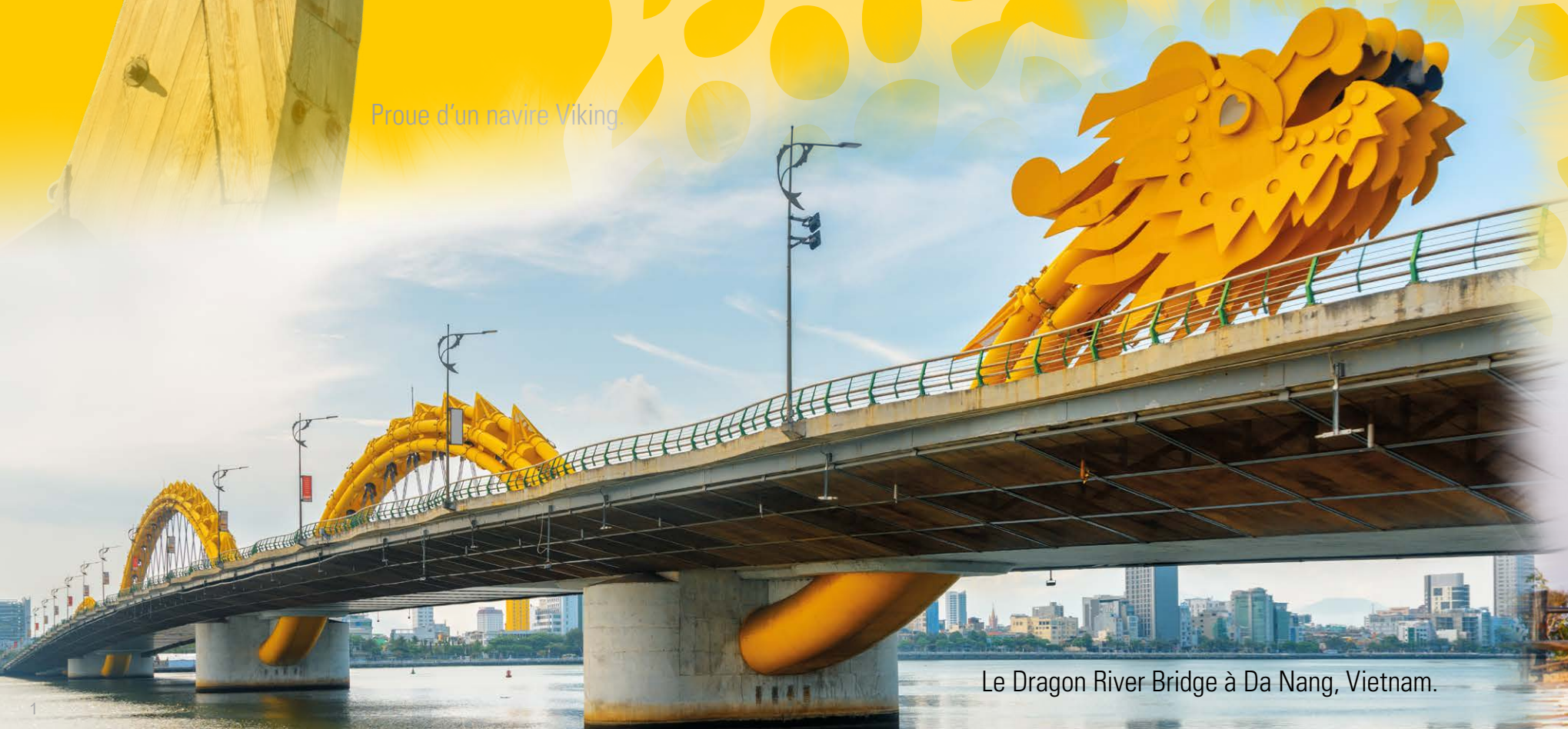
Le Dragon River Bridge à Da Nang, Vietnam.