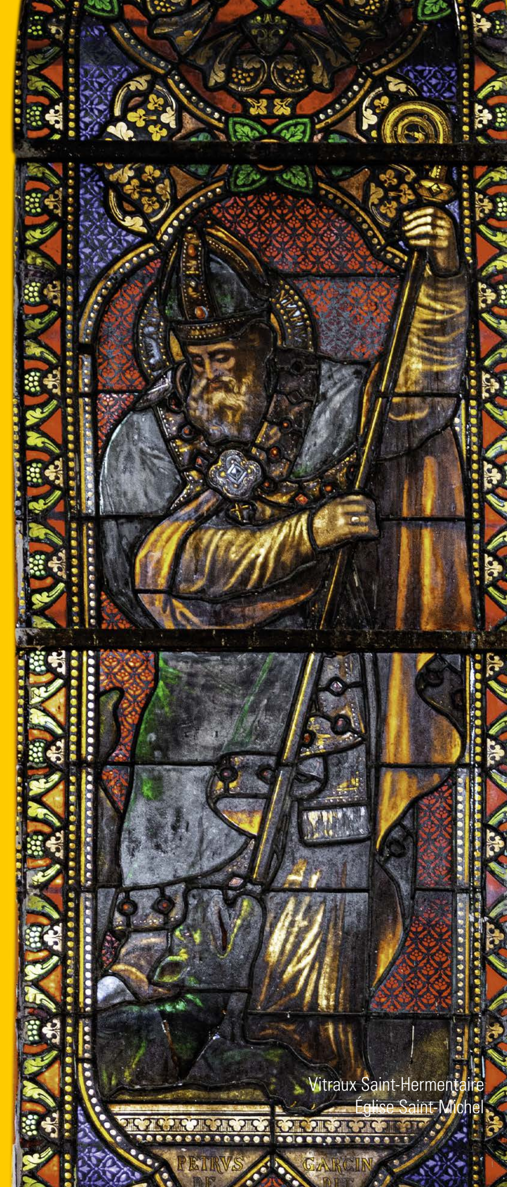
Vitraux Saint-Hermentaire Église Saint-Michel