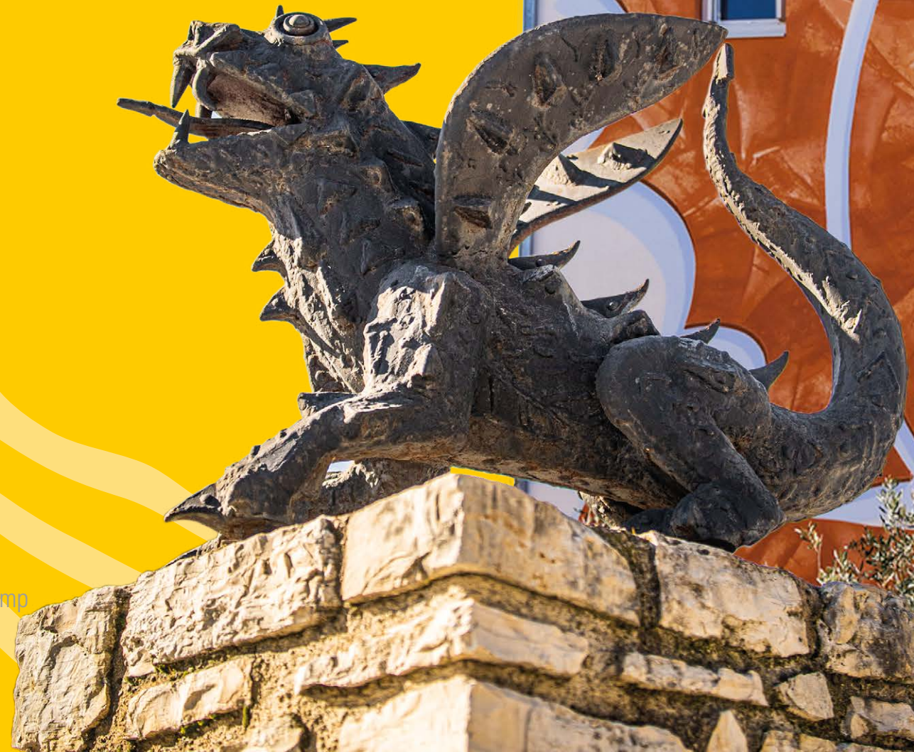
Bd Joseph Collomp