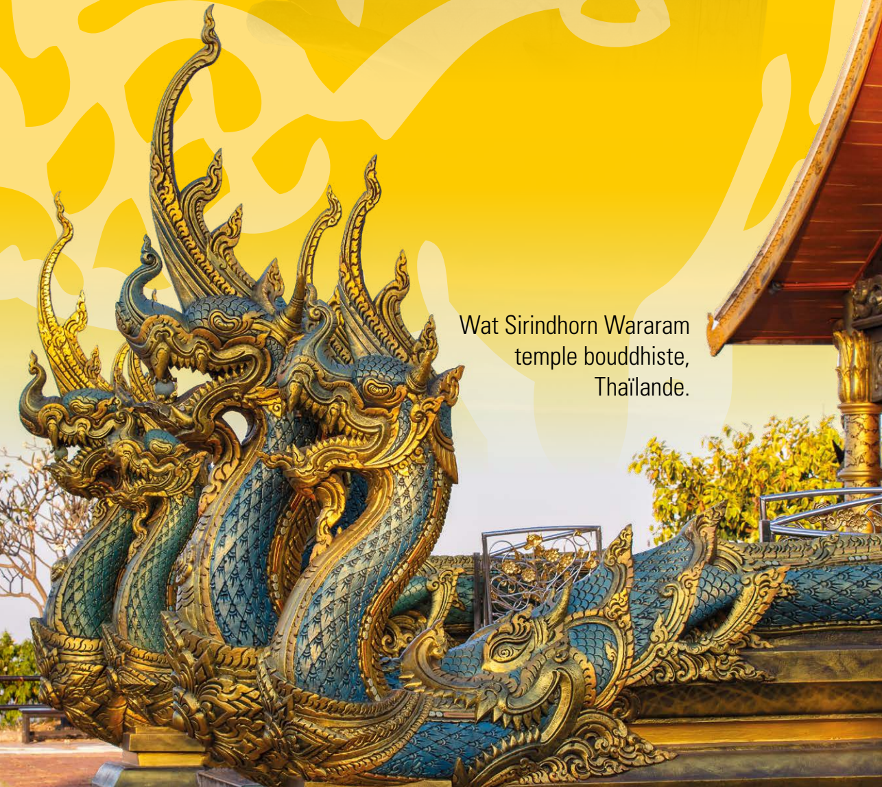
Wat Sirindhorn Wararam temple bouddhiste, Thaïlande.