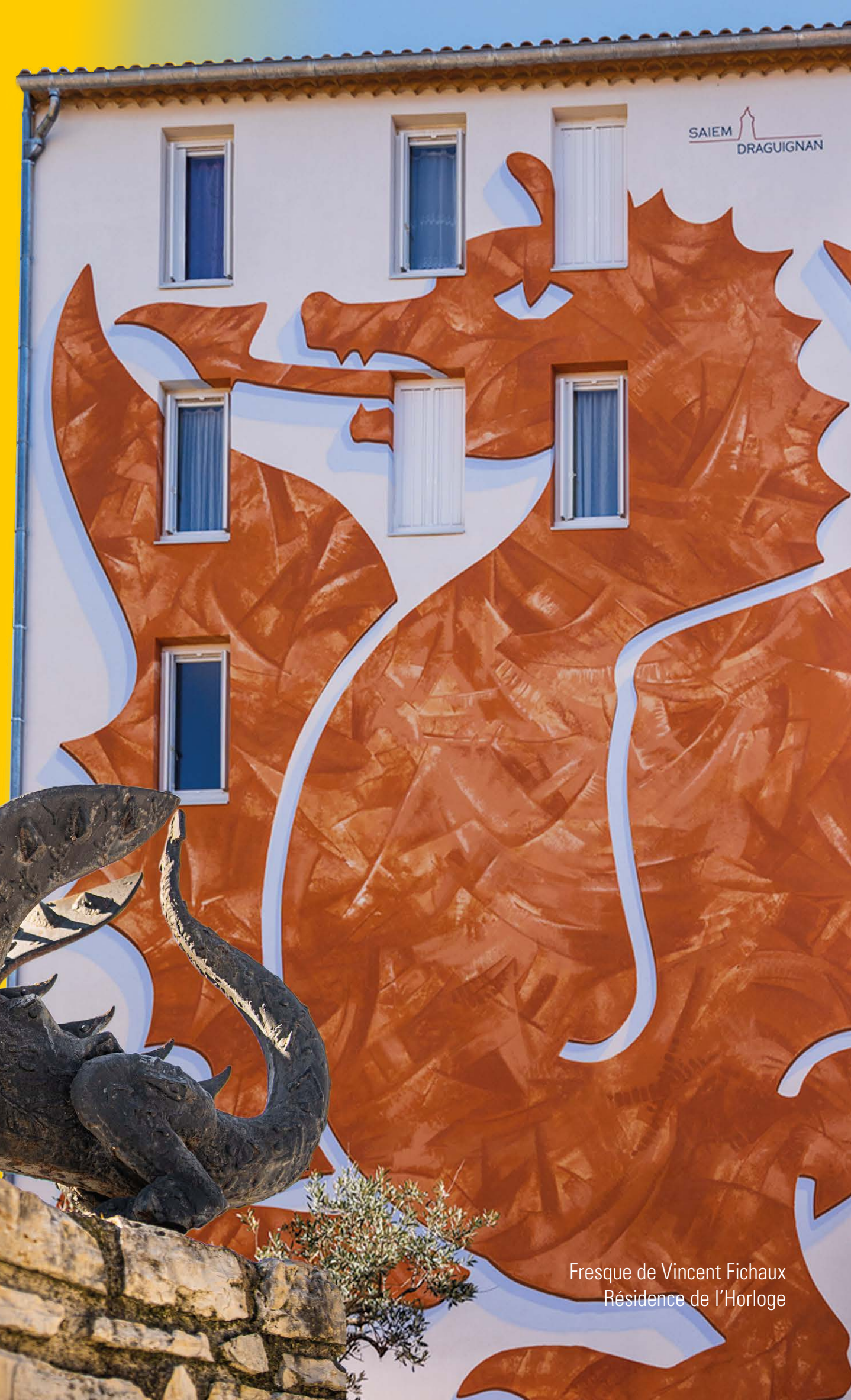
Fresque de Vincent Fichaux Résidence de l'Horloge