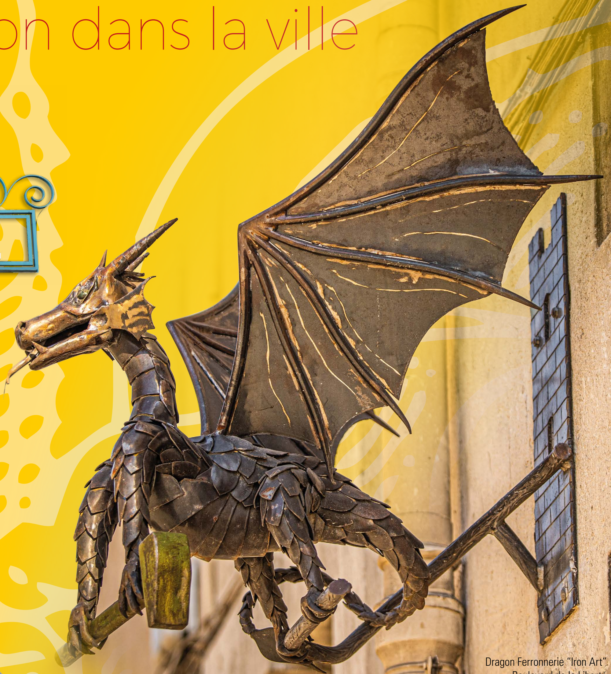
Dragon Ferronnerie "Iron Art" Boulevard de la Liberté