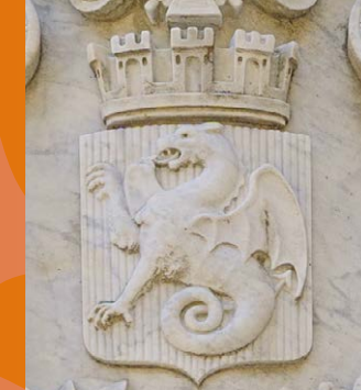
Cour d'honneur de l'Hôtel de Ville