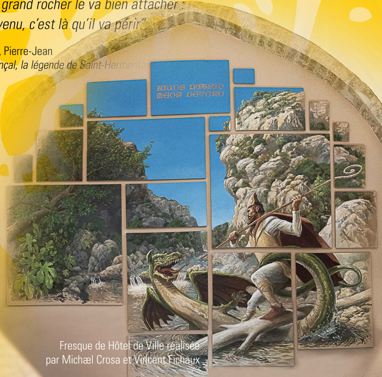
Fresque de Hôtel de Ville réalisée par Michael Crosa et Vincent Fichaux