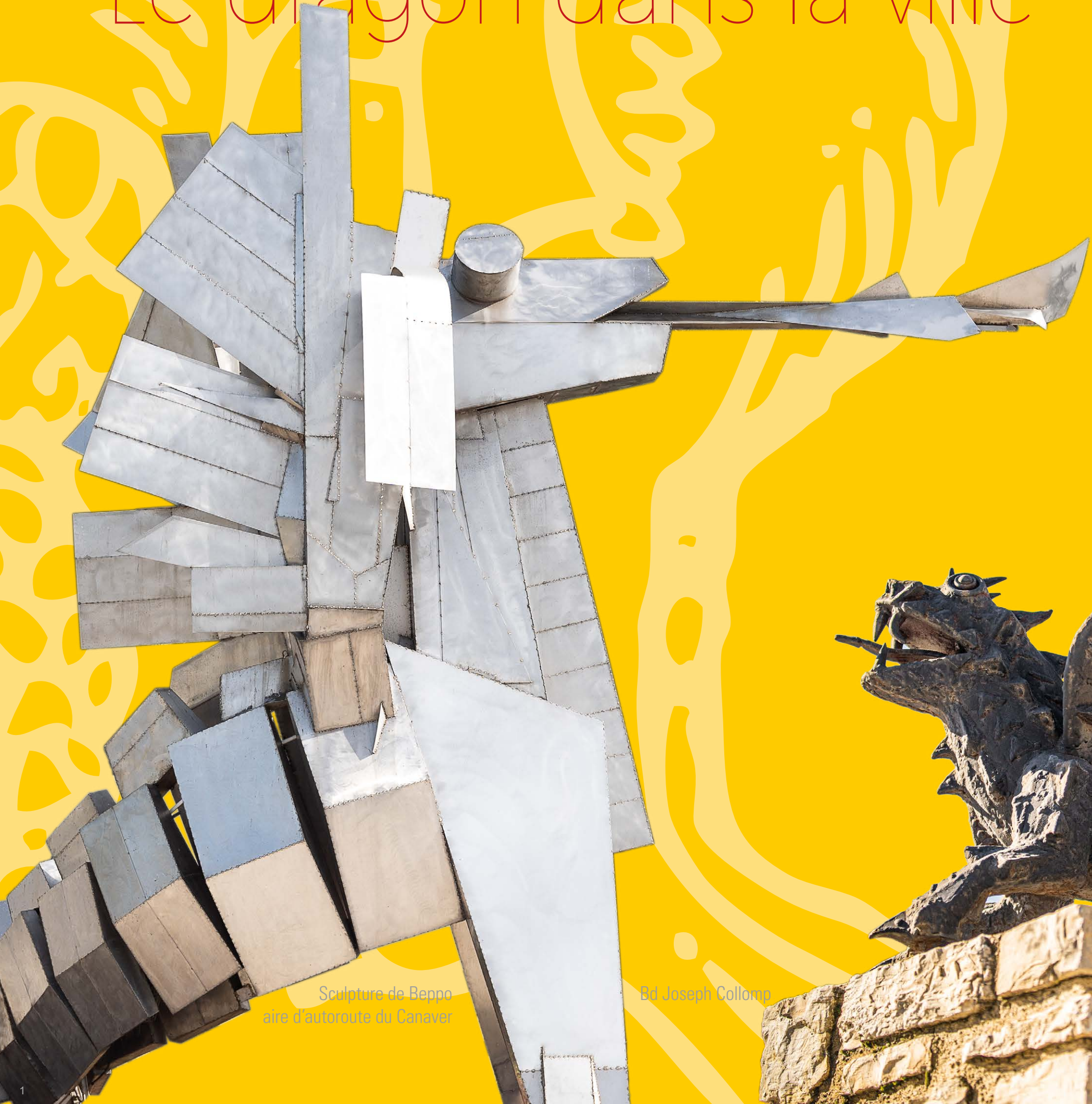
Sculpture de Beppo aire d'autoroute du Canaver