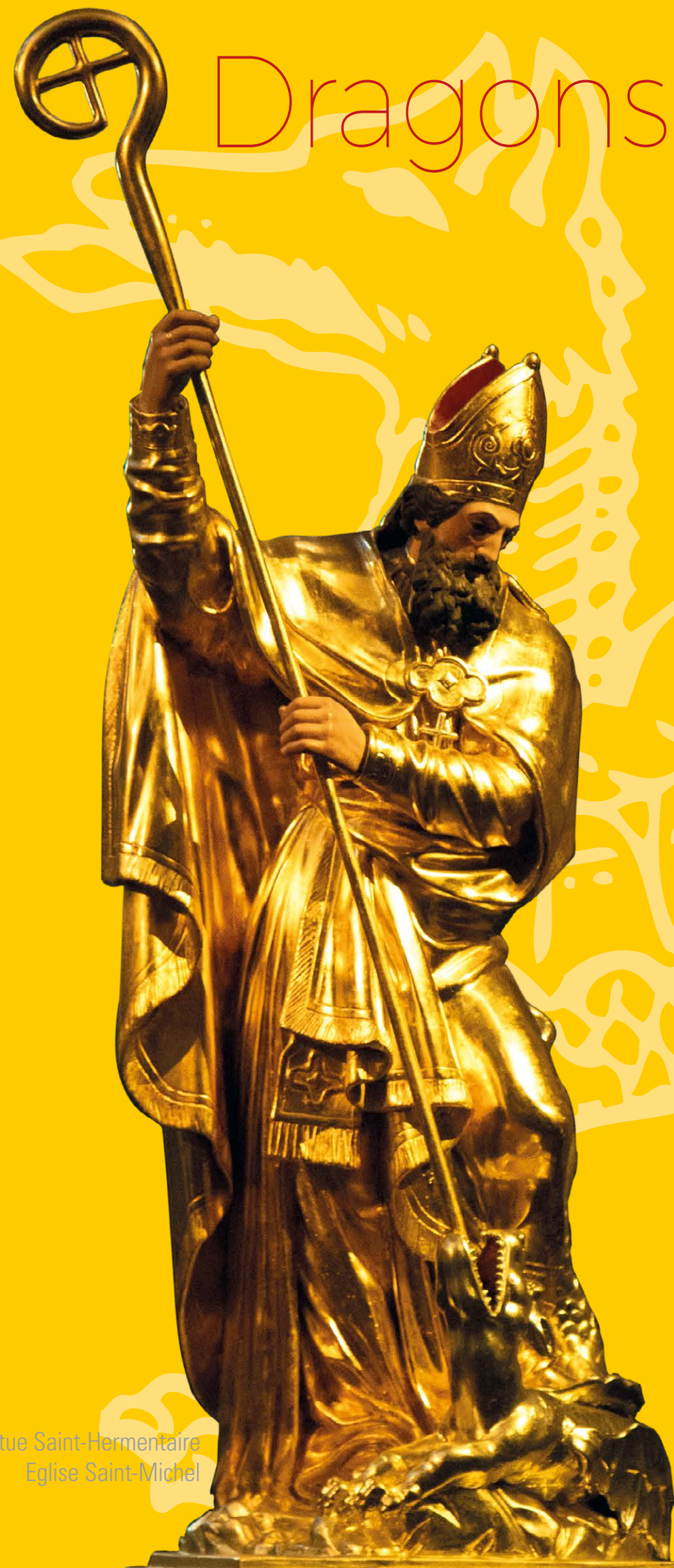
Statue Saint-Hermentaire Église Saint-Michel