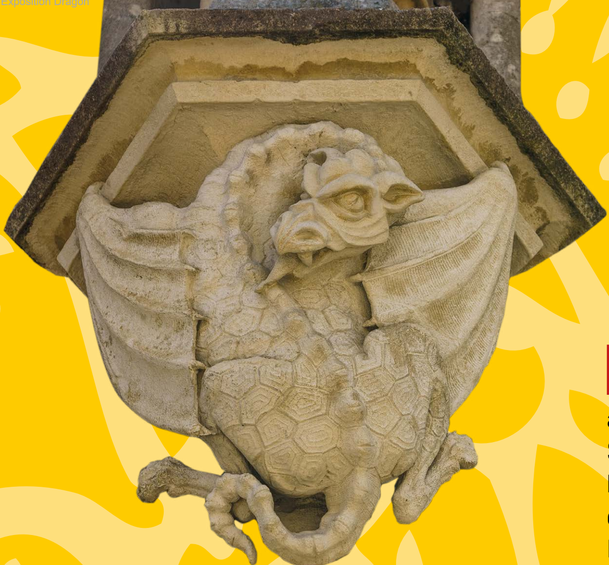
Notre-Dame du Peuple