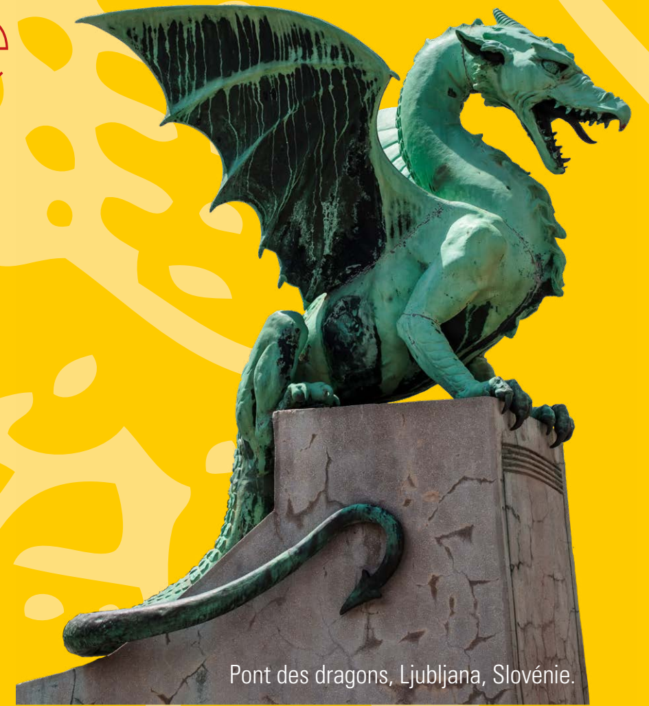
Pont des dragons, Ljubljana, Slovénie.