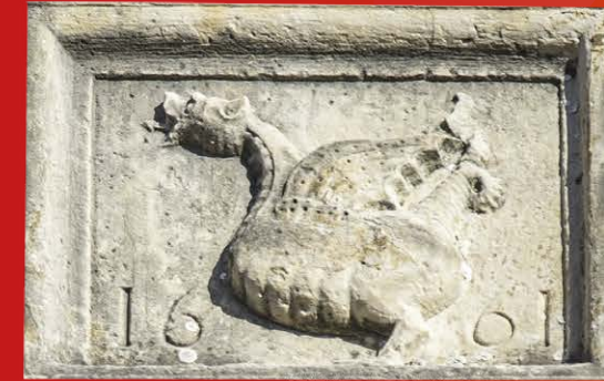
Tour de l'Horloge