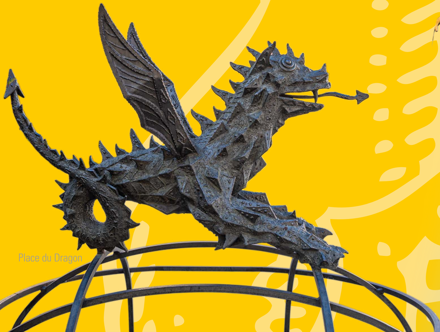
Place du Dragon