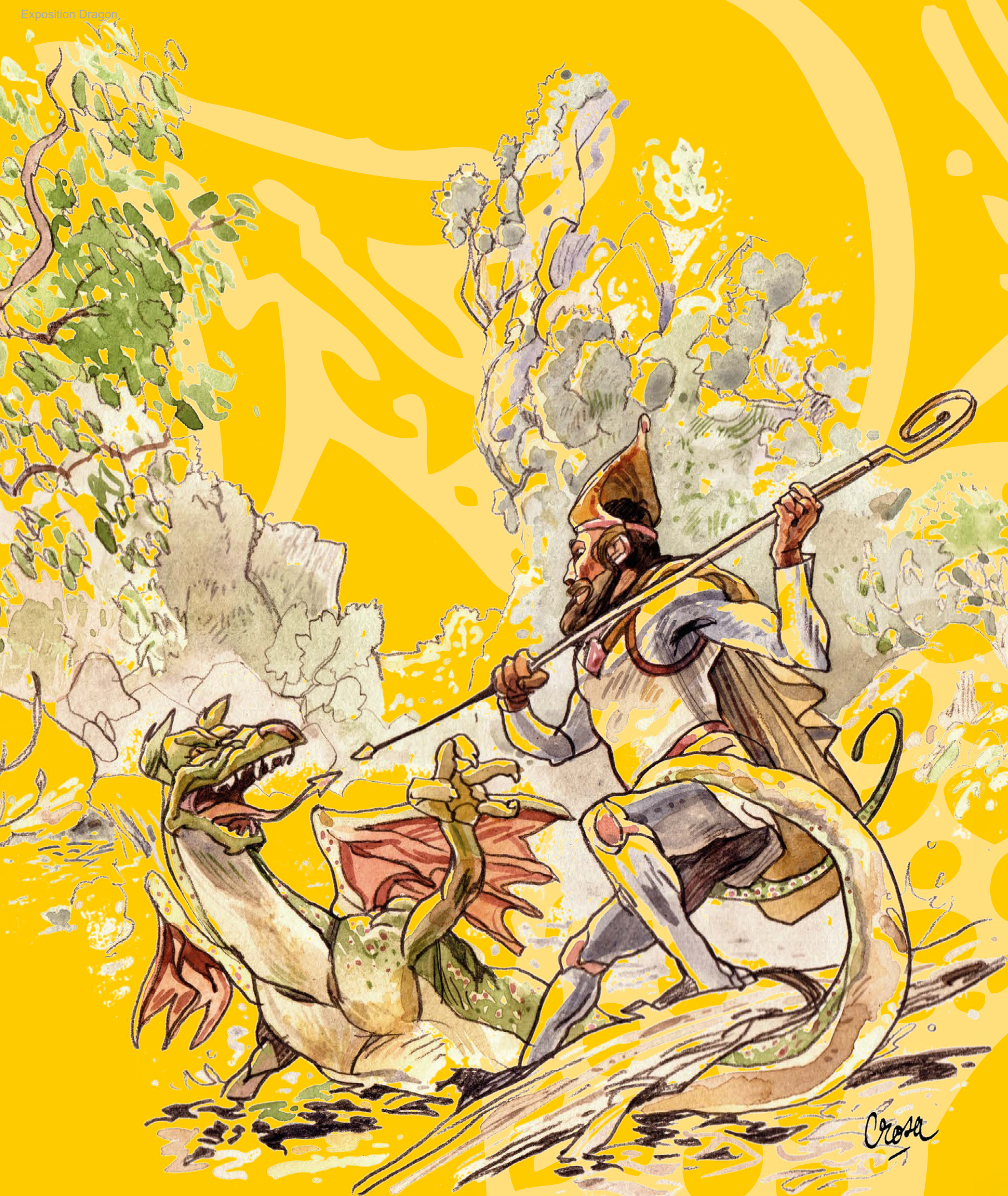
Croquis de la fresque de Hôtel de Ville de Michael Crosa

Source : Gayrard, Pierre-Jean Un dragon provençal, la légende de Saint-Hermentaire Actes Sud, 2001.