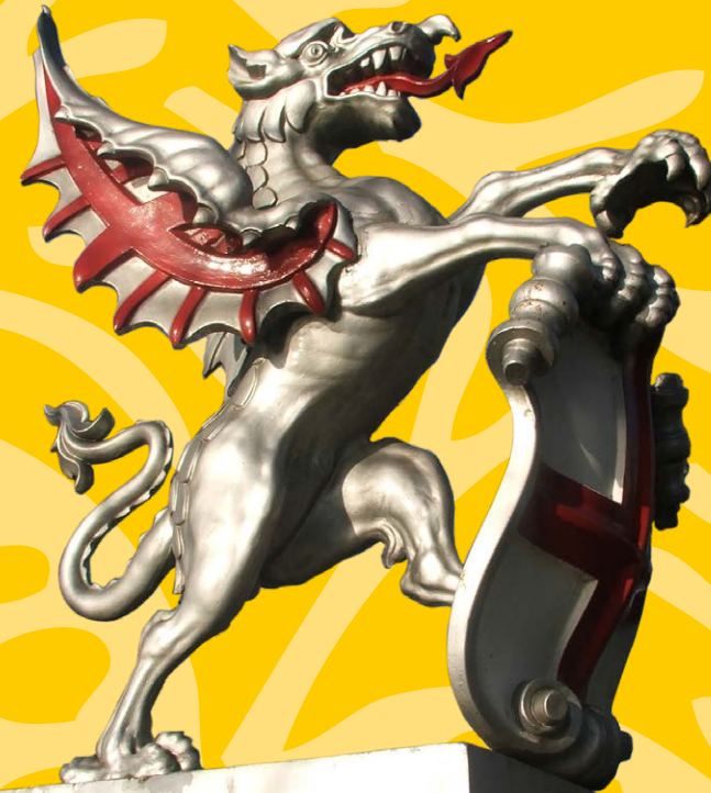
Emblème de Londres, Angleterre.